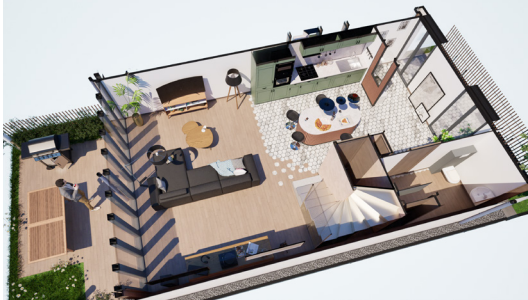
Conception d'une maison pour particulier