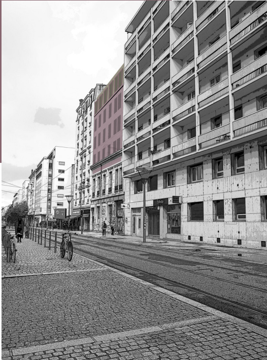
Réhabilitation + Surélévation // Etude en cours