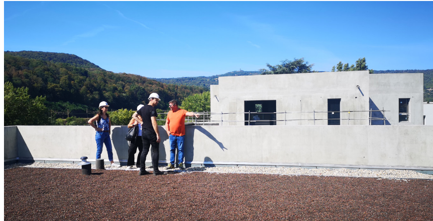
LG Promotion - Résidence ESPRIT FONTAINES - 69270 Fontaines-sur-Saône

Nous avons à cœur de proposer une mission complète pour nos projets. Le pôle chantier assure ainsi une continuité parfaite depuis les premières phases d'étude jusqu'à la réalisation finale, dans une vision globale de cohérence du projet.