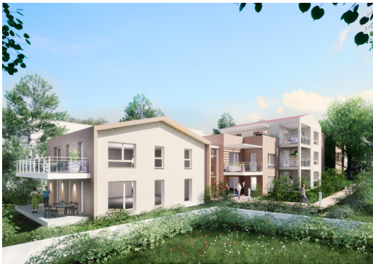
Perspectives produites par l'agence