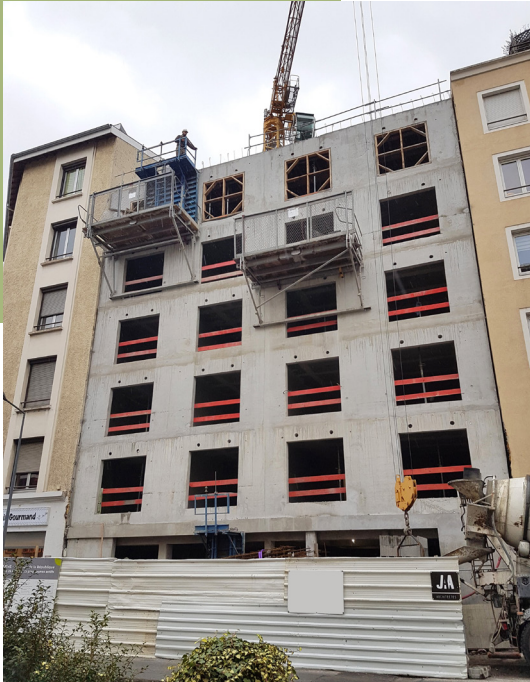
VILOGIA - Résidence IZIDOM - 69100 Villeurbanne