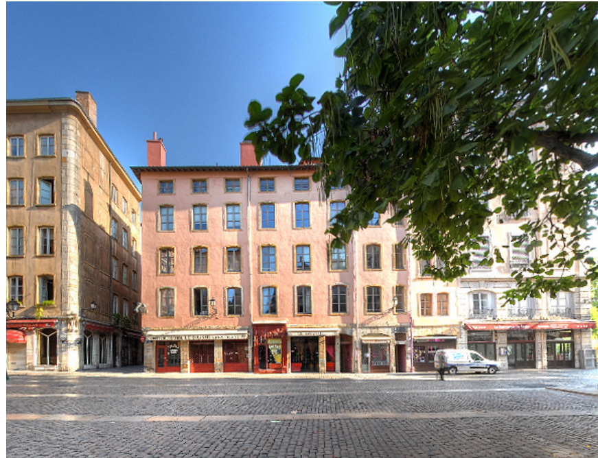
Réhabilitation globale - 4 Place du Change - 69005 Lyon // Mission Complète